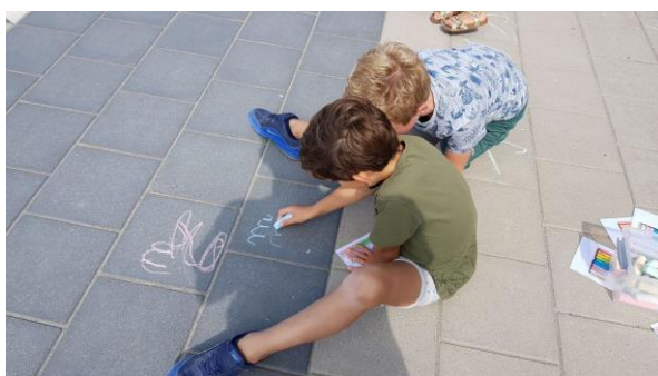
ook op het schoolplein...