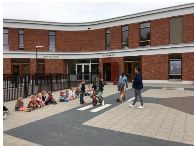
De opening op het verkeerspleintje...

keer op het verkeersplein op het kleuterspeelplein. Diverse verkeerssituaties werden nagespeeld, waarbij de leerkrachten het natuurlijk net even verkeerd deden. Gelukkig wisten de kinderen onder leiding van de verkeersbrigadier heel goed te vertellen hoe het wel moest. De komende periode gaan we in de klas verder aan de slag met dit thema. Verschillende vervoersmiddelen, verkeersborden en situaties in het verkeer zullen aan bod komen in de kringen, tijdens de werkles, maar ook buiten en tijdens de gymles. Klaar voor de start... af!