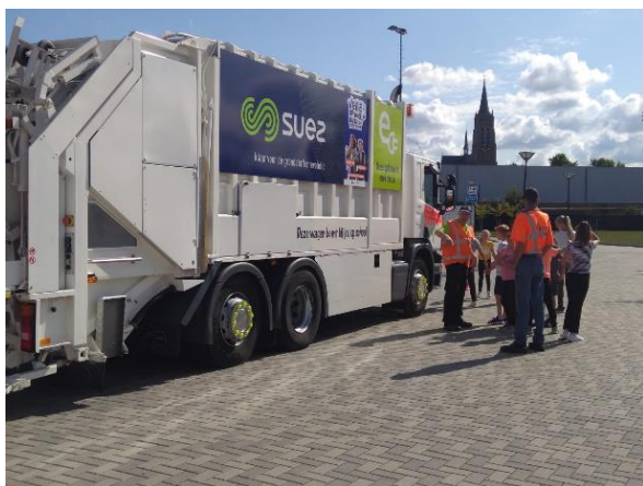
Tot waar ben ik te zien?

Na de les in de klas gingen de kinderen naar buiten om de opgedane kennis in de praktijk te brengen met behulp van een aangepaste vuilniswagen. Zeker het kijkje in de cabine was verhelderend. Hierdoor hebben de kinderen gezien wat een vrachtwagenchauffeur wel (en nog belangrijker) niet kan zien achter het stuur. Mocht u ook met uw kind willen praten over dit gevaarlijke verkeersprobleem? Op internet zijn diverse duidelijke filmpjes te vinden hierover. En daarnaast natuurlijk uw kind in de praktijk er op wijzen!