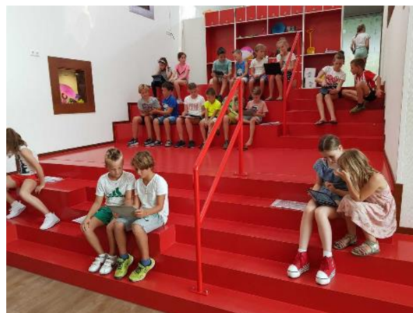
De rode trap is gevuld tijdens het BOUW-lezen.

maar is bijvoorbeeld ook erg belangrijk voor de ontwikkeling van de fantasie. Zo adviseren we u als ouder dan ook dringend veel (voor) te lezen met uw kind. Lezen is ook bij ons op school één van de belangrijkste onderdelen van het onderwijs. Mede daarom hebben wij het BOUW lezen uitgebreid van 2 keer naar 4 keer per week. Tijdens dit lees-kwartiertje lezen kinderen uit de bovenbouw samen met de kinderen uit de onderbouw. Altijd een mooi gezicht hoe zorgzaam de tutoren omgaan met hun leerlingen!