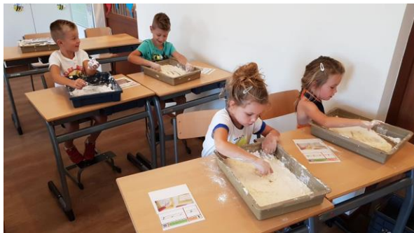
Met de betrokkenheid zit het zeker goed...

strak kader. Het zorgt in ieder geval voor veel inzet bij de kinderen! Deze is ook mooi terug te zien op de foto's op onze site.