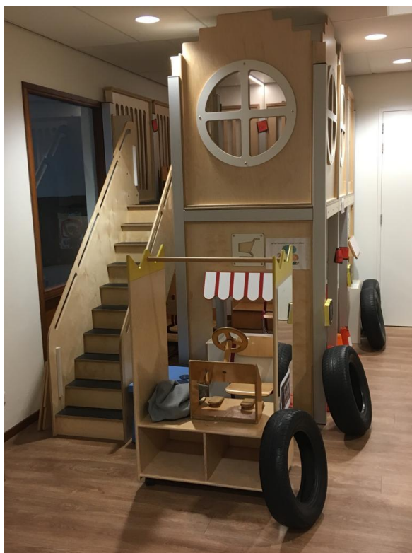
Stap maar in.....

het ook weleens een dubbeldekker kon zijn, is dit idee verder uitgewerkt. Een kijkje bij het busstation waarbij de kinderen ook echt even een bus in mochten, gaf de kinderen ideeën over hoe de bus eruit moest komen te zien. Kinderen benoemden wat ze zagen (of juf Anja, als ze niet wisten hoe het heette) en juf Anja maakte foto's. Terug op school hebben de kinderen samen bedacht hoe ze van het huis een bus konden maken en wat ze hiervoor nodig hadden. Vervolgens ging iedereen aan de slag. Spullen werden gemaakt, woorden gestempeld, het huis werd opgeruimd en opnieuw ingericht. Met als uiteindelijke resultaat een prachtige dubbeldekker. En wat een betrokkenheid, eigenaarschap en participatie van de kinderen; geweldig om te zien!