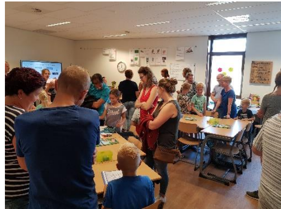
En natuurlijk even je plekje laten zien...

Vorige week donderdag was u in de gelegenheid om op een laagdrempelige manier kennis te maken met de leerkrachten en de nieuwe klas van uw kind(eren) tijdens de inloopmiddag- en avond. Terwijl het 's middags nog erg rustig was, begon het avondgedeelte meteen met een gezellige drukte. Het was mooi om te zien hoe de kinderen trots de nieuwe groep lieten zien als volleerde gidsen. Voor ons als team was het een geslaagde avond. Heeft u verbeterpunten? We horen het graag van u!