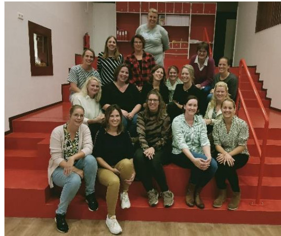
Het bestuur van de oudervereniging 22-23...

Deze week was de eerste vergadering van de oudervereniging. Hierin werden de plannen voor dit schooljaar besproken en de bijbehorende werkgroepen ingedeeld. Op donderdagavond 20 oktober is de algemene ledenvergadering (de uitnodiging volgt), waarin het bestuur gekozen wordt en waarin de vrijwillige ouderbijdrage wordt vastgesteld.